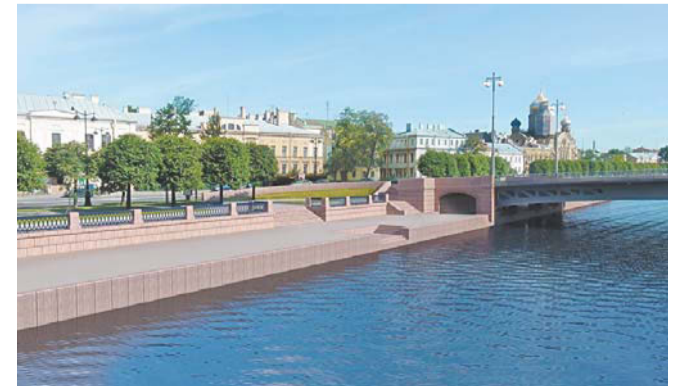
Проект Ново-Адмиралтейского моста | GOV.SPB.RU

– К проектам мы подойдём с учётом опыта Большого Смоленского моста, – подчеркнул губернатор. METRO