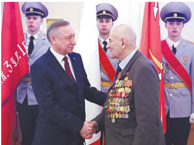
Губернатор Петербурга вручил медали ветеранам