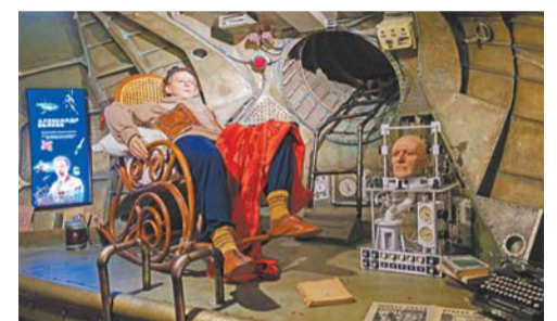
Фрагмент зала, посвящённый творчеству Александра Беляева