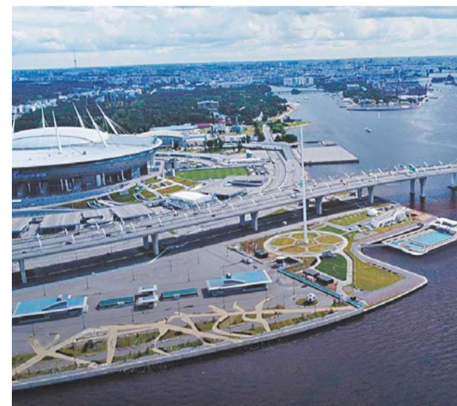
| ВСЕ ФОТО: Т.МЕ/А. БЕГЛОВ