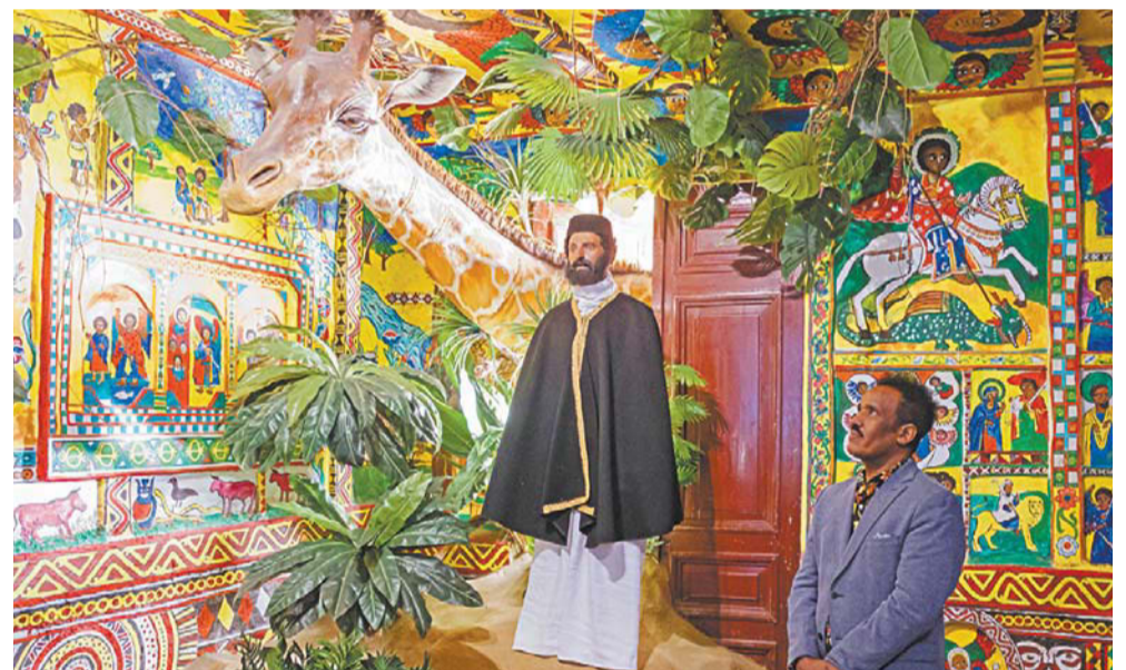
Жираф из знаменитого стихотворения Николая Гумилёва стал украшением инсталляции