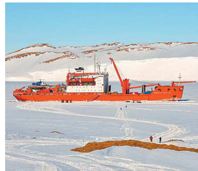
В Антарктиду сотрудники полярных станций прибывают на ледоколе