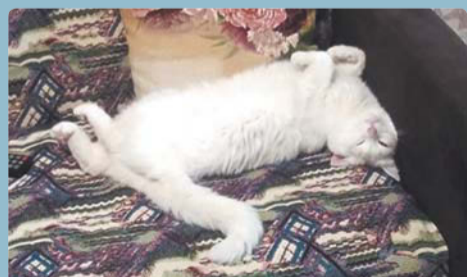
«Сладких грёз от Филюши», – хозяйка Юлия.

«Мы играли, мы играли, Наши лапоники устали. Мы немножко отдохнём И опять играть пойдём. Наша Сюзьчик, рыжмуля», – пишет хозяйка Лариса.