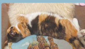
«Кэтти. Любимое кресло», – пишет хозяйка Azetta.

ДРУЗЬЯ , конкурс «Без задних лап» продолжается! Присылайте фото ваших спящих питомцев на почту konkurs@metronews.ru и следите за ними в нашем телеграм-канале! Каждый день мы выкладываем фото самого милого спящего усатого-полосатого! Переходите по ссылке и смотрите, вдруг ваш питомец уже стал котиком дня!