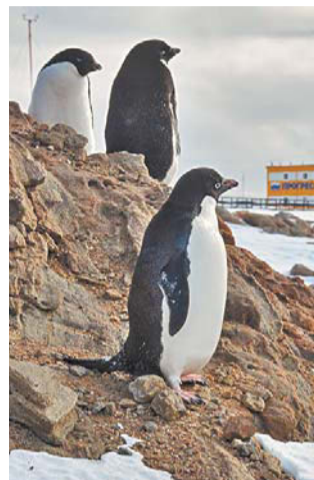
Пингвины очень любопытны и часто сами подходят к людям