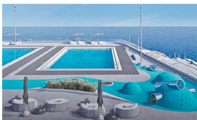
Комплекс из двух открытых подогреваемых бассейнов

Первый – комплекс из двух открытых подогреваемых бассейнов рядом с общественным пространством «Флажтоки». Второй – павильоны баз водных видов спорта у парка 300-летия Санкт-Петербурга. METRO