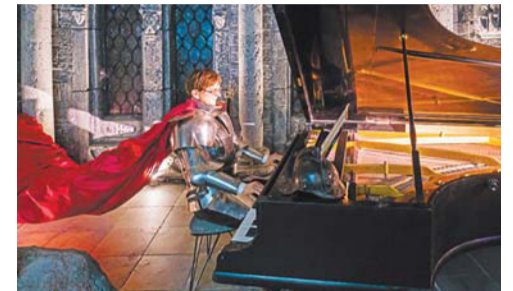
Старый рояль для Дмитрия Шостаковича приобрели на интернет-сервисе