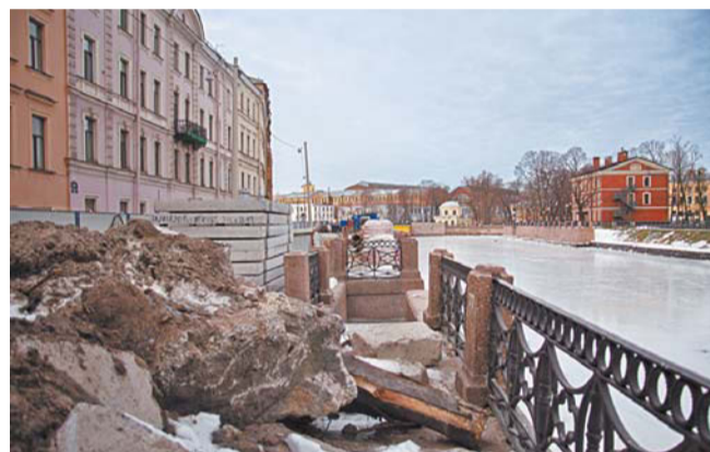
За два с лишним века берег накренился почти на 10 см, на тротуарах просели плиты, многочисленные дефекты образовались на перильном ограждении