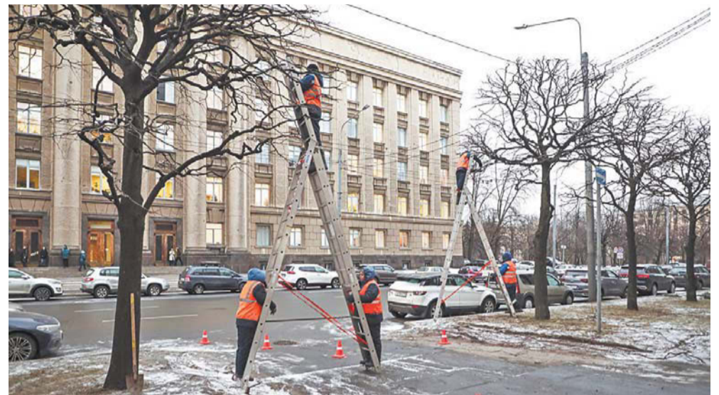
В Петербурге продолжается формовка деревьев